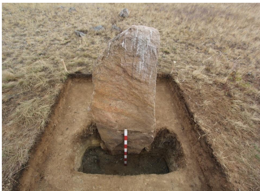
Рис. 7. Назар-3. Менгир

В ареале тасмолинской культуры с курганами связаны также и жертвенники. Они имеют округлую или овальную форму. Их диаметры чаще от 1,5 м до 3–4 м. Иногда они содержат предметы конской узда [16] как свидетельства проведённого обряда жертвоприношения лошади. Тасмолинские околокурганые жертвенники, изваяния, культовые камни в виде менгиров и стел генетически связаны с предшествующей культурой бегазы-дандыбаевской эпохи Центрального Казахстана [17, с. 27–28; 18]. В эпоху поздней бронзы, как и в андроновское время, в степях Центрального Казахстана были широко распространены и каменные жертвенники, и многочисленные культовые камни [19; 20].