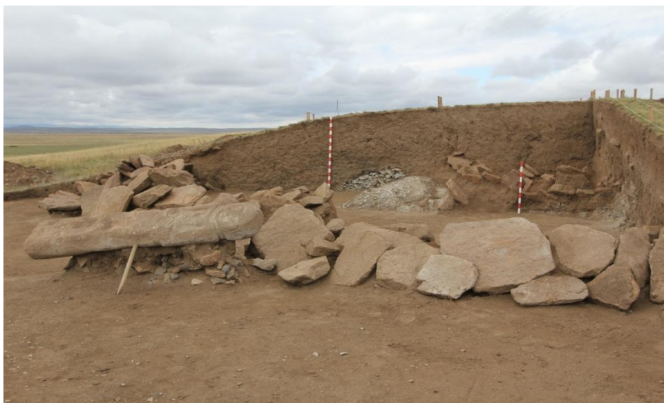
Рис. 2. Курган-2 могильника Кособа в ходе раскопок

В настоящее время каменные изваяния сакского времени Центрального Казахстана датируются периодом VII–V вв. до н. э. [9]. Те или иные коррективы по датировке изваяний будут выполняться по мере дальнейшей разработки этой темы.