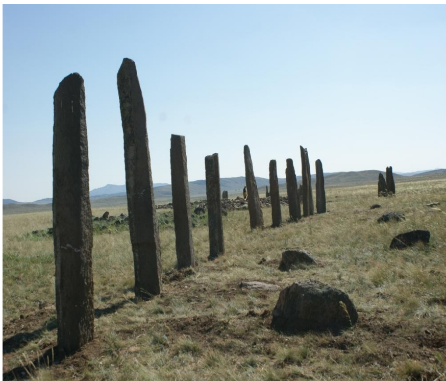
Рис. 5. Комплекс «Курган 37 воинов». Менгиры в северо-западной части

Летом 2016 года проводились исследования на могильнике Назар-3. Здесь обнаружено всего 18 древних сооружений: 4 кургана, 4 менгира и 10 небольших округлых жертвенников. Все они образуют три параллельные линии, протянутые с северо-запада на юго-восток. Самую восточную линию образуют курганы. С западной стороны их находятся менгиры, а ещё западнее проходит линия жертвенников. Курган-2 является самым крупным. Он имеет овальную форму, его диаметр – 16x12 м, высота – 0,9 м. На расстоянии 6,8 м западнее кургана находится самый крупный менгир (рис. 6). Его общая длина – 2 м. Он на 1,2 м выступает над землей и на 0,8 м вкопан в землю (рис. 7). Курган оказался сильно разграбленным и могила, глубиной 0,5 м, оказалась пустой. Тем не менее, исходя из особенностей конструкции кургана, раннесакская дата памятника (кургана и менгира) не вызывает сомнений.