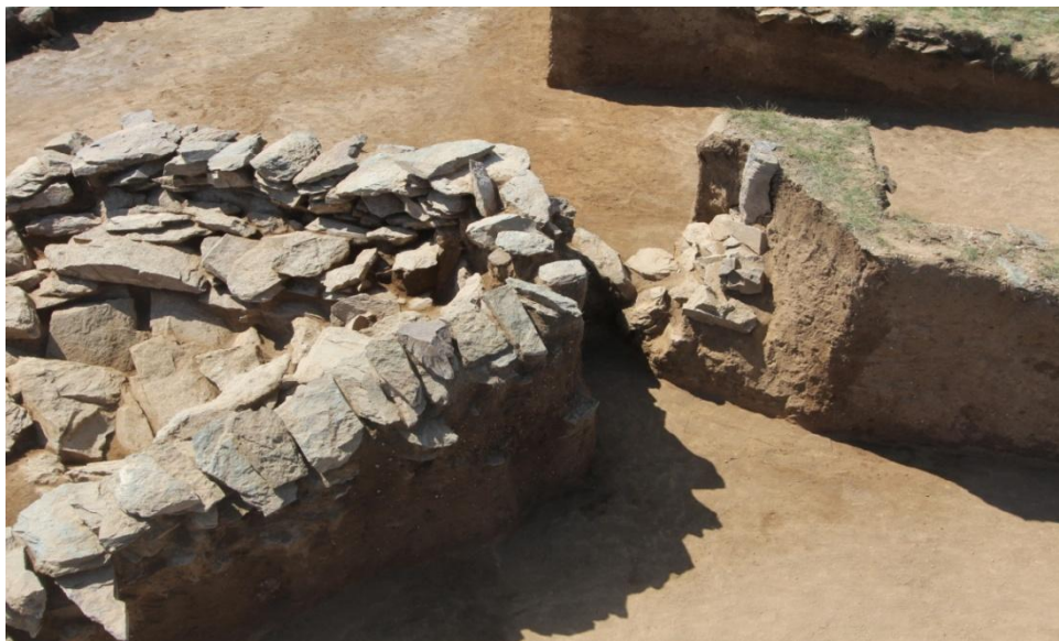
Рис. 3. Курган-2 могильника Тандайлы-2. Каменное надмогильное сооружение и нижняя часть менгира. Вид с севера

В ходе раскопок кургана-2 могильника Тандайлы-2 в центре насыпи была обнаружена каменная кладка в форме треугольника, обращённого на восток. Основу сооружения образуют две многослойные выкладки из плит, на плане образующие острый угол со срезанной верхушкой. Внутри этого сооружения, заложенного камнями, находилась могила, ориентированная длинной осью по линии ЮЗ-СВ. На расстоянии 1 м к западу от сооружения находилась нижняя часть вертикально стоящей плиты (рис. 3).