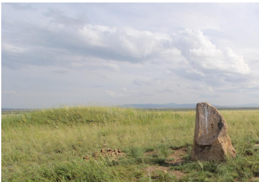
Рис. 6. Назар-3. Общий вид кургана-2 с менгиром