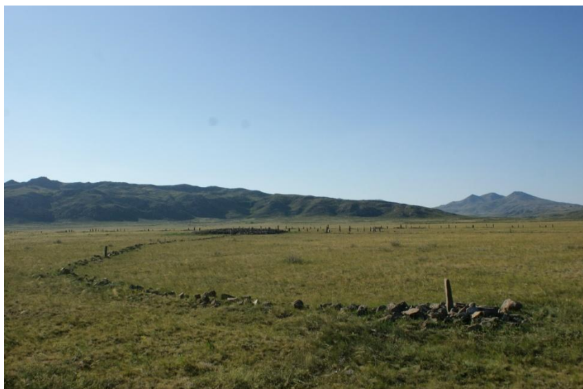
Рис. 4. Комплекс «Курган 37 воинов». Общий вид. Менгиры